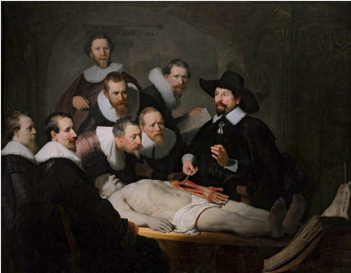
Figura 8. Lección de Anatomía de Reembrant. Copia que se exhibe en el hall de la biblioteca Countway de Harvard