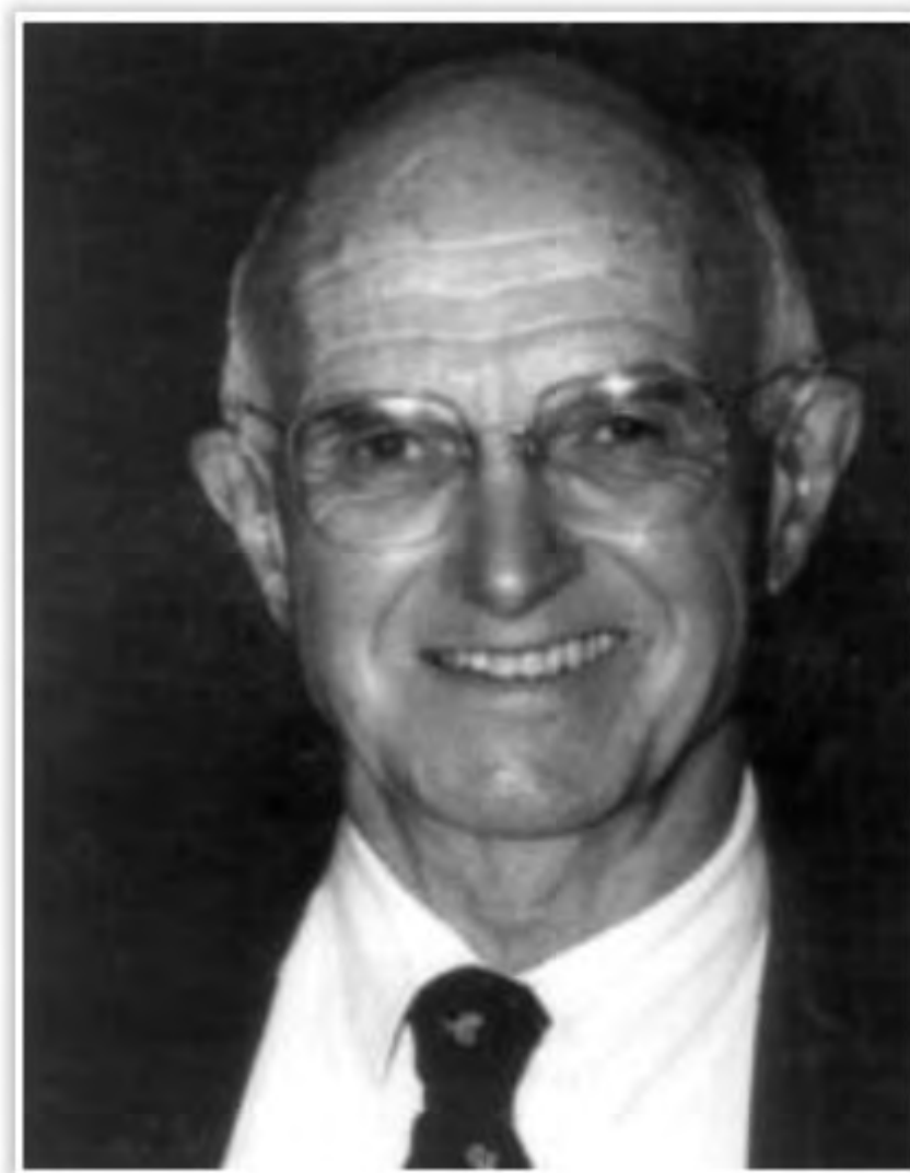
Figura 2. Joseph E Murray (1919-2012), cirujano plástico que recibió el premio Nobel en 1990

A partir de aquel momento Murray empezó a trabajar en el laboratorio de experimentación en trasplante de riñones en perros. Sus jornadas empezaban a las seis de la mañana. Cuando no iba al quirófano experimental, se acercaba al matadero a diseccionar diversos tipos de animales.