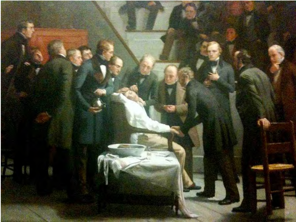
Figura 9. La primera demostración pública de la utilización de anestesia con éter, realizada en el Hospital General de Massachusetts en 1846. Cuadro al oleo de Robert Hinkley