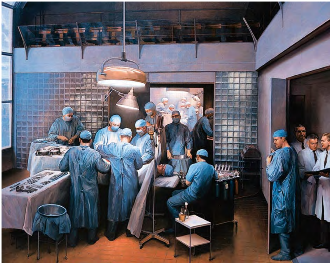
Figura 7. El primer trasplante de riñón con éxito. Cuadro al oleo de Joel Babb, 1995

los grupos. Es el que con su dirección, estímulo y apoyo ha hecho posible este logro excepcional de la medicina. Los clínicos que aparecen detrás de Harrison representan la importancia de la Medicina, la Nefrología y la Anatomía Patológica, junto con el conocimiento colectivo de las otras disciplinas medicas clínicas y básicas de la Universidad de Harvard que, en su esfuerzo colectivo y coordinado, contribuyen al progreso del conocimiento de la enfermedad y a la lucha frente el rechazo de órganos, único camino para alcanzar el éxito. Finalmente, el quirófano del fondo, aunque está en último plano, aparece muy claro, representando el futuro iluminado de los más de 700.000 pacientes con enfermedades crónicas terminales que desde entonces se han beneficiado de los trasplantes de órganos. El quirófano y la acción representada en el cuadro están muy próximos a la realidad de los hechos porque el autor, Joel Babb, contó con fotografías realizadas ese día y con retratos de cada uno de los protagonistas. Babb, en este cuadro utilizó la técnica de esfumato , inventada por Leonardo Da Vinci y ampliamente utilizada durante el Renacimiento. Hace un perfecto tratamiento y estudio de la luz en el cuadro, situando dos focos: uno posterior que ilumina de manera etérea el quirófano donde se realiza la extracción; otro segundo, exterior, que ilumina desde una posición angular a los personajes del primer plano.