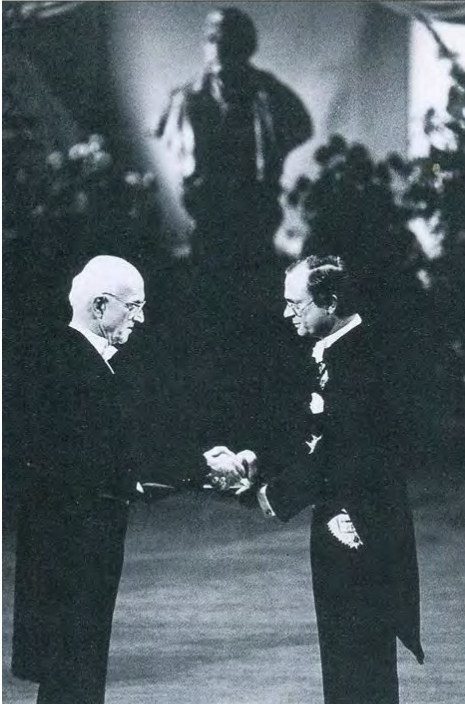
Figura 10. Joseph Murray estrechando la mano del Rey de Suecia en la ceremonia de entrega del Premio Nobel

No cabe duda de que el papel de Moore (10) , cediendo el protagonismo a sus colaboradores, facilitó el camino, aunque en ocasiones resultaría ingrato. Un cargo como el que él desempeñó, para hacerse bien necesita una gran dosis de generosidad. Cuando un