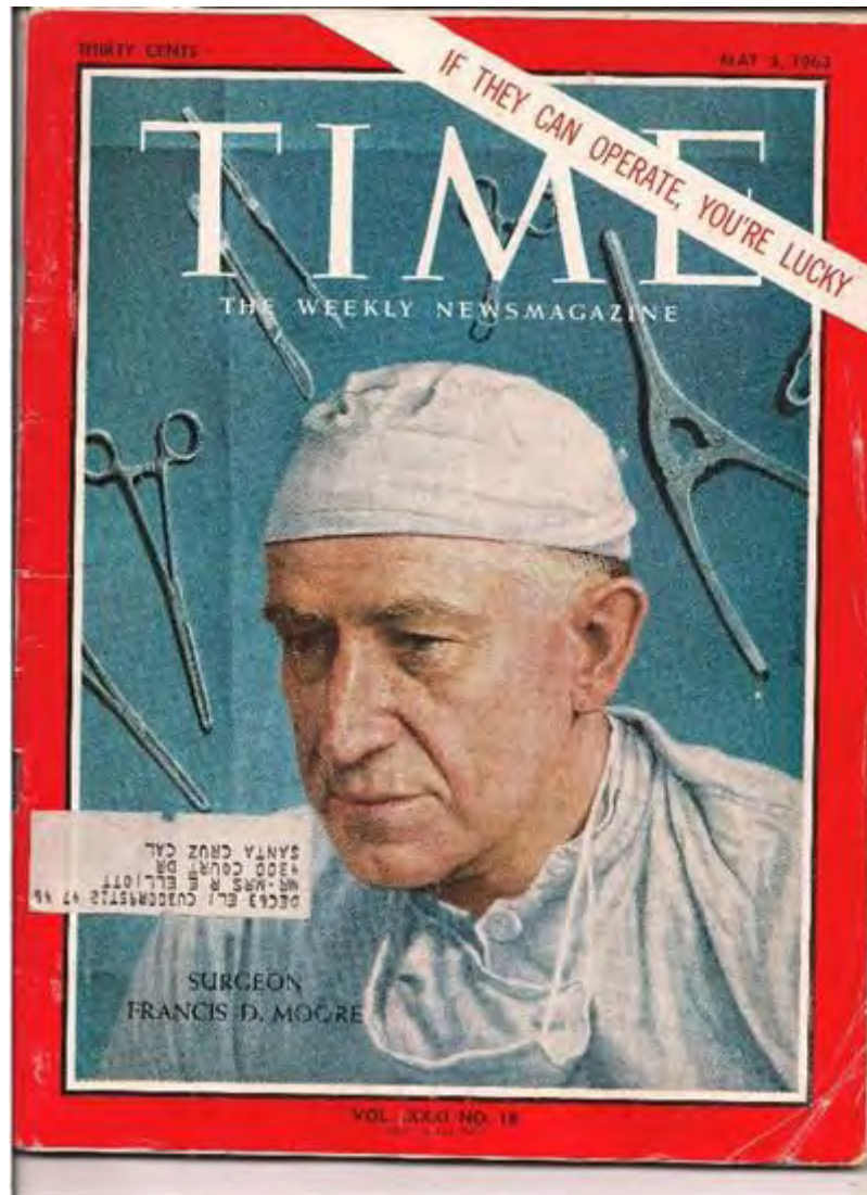
Figura 6. Francis Moore (1913-2001) en la portada de la revista Time