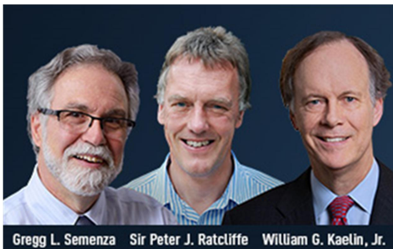
Gregg L. Semenza Sir Peter J. Ratcliffe William G. Kaelin, Jr.

Los científicos estadounidenses William G. Kaelin (Dans-Farber Cancer Institute) y Gregg L. Semenza (Johns Hopkins Hospital), así como el británico Peter J. Ratcliffe (Universidad de Oxford) han ganado el Nobel de Medicina 2019 por sus estudios sobre el