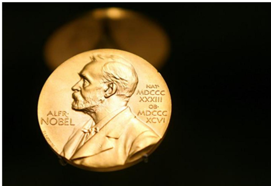
Figura 1. La medalla del Premio Nobel donde aparece la figura de Alfred Nobel y los años de su nacimiento y defunción.

solamente la tradición por las dos grandes guerras mundiales, cada diez de diciembre tiene lugar la doble ceremonia de los Premios Nobel en el Ayuntamiento de Oslo (donde se entrega el Premio Nobel de la Paz) y, horas más tarde, en el Konserthus de Estocolmo donde se conceden los demás galardones en una sencilla y elegante ceremonia a la que asisten los académicos responsable de la selección final de premiados y la familia real de Suecia (4) .