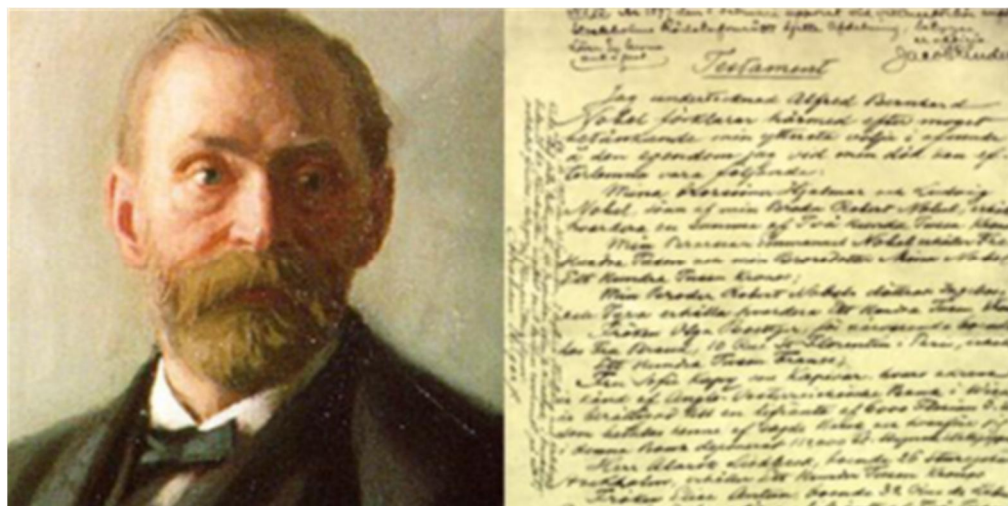
Figura 2. Alfred Nobel, inventor y fundador de los Premios Nobel junto a un fragmento de su testamento, donde se hace constar la última voluntad del inventor en relación con los Premios que llevan su nombre (5) https://www.google.es/search?newwindow=1&client=firefox-b&dcr=0&tbm=isch&sa=1&q=Fotos+de+Alfred+Nobel+&oq

Los Premios Nobel, instituidos por el químico e inventor Alfred Nobel en su testamento, y organizados y administrados desde hace más de un siglo por la Fundación Nobel (1,2) , es uno de los galardones más prestigiosos del mundo y se concede tal como figura en la página oficial del Premio For the greatest benefits to humankind " (traducción libre al castellano "Para mayor beneficio de la humanidad" (1) .