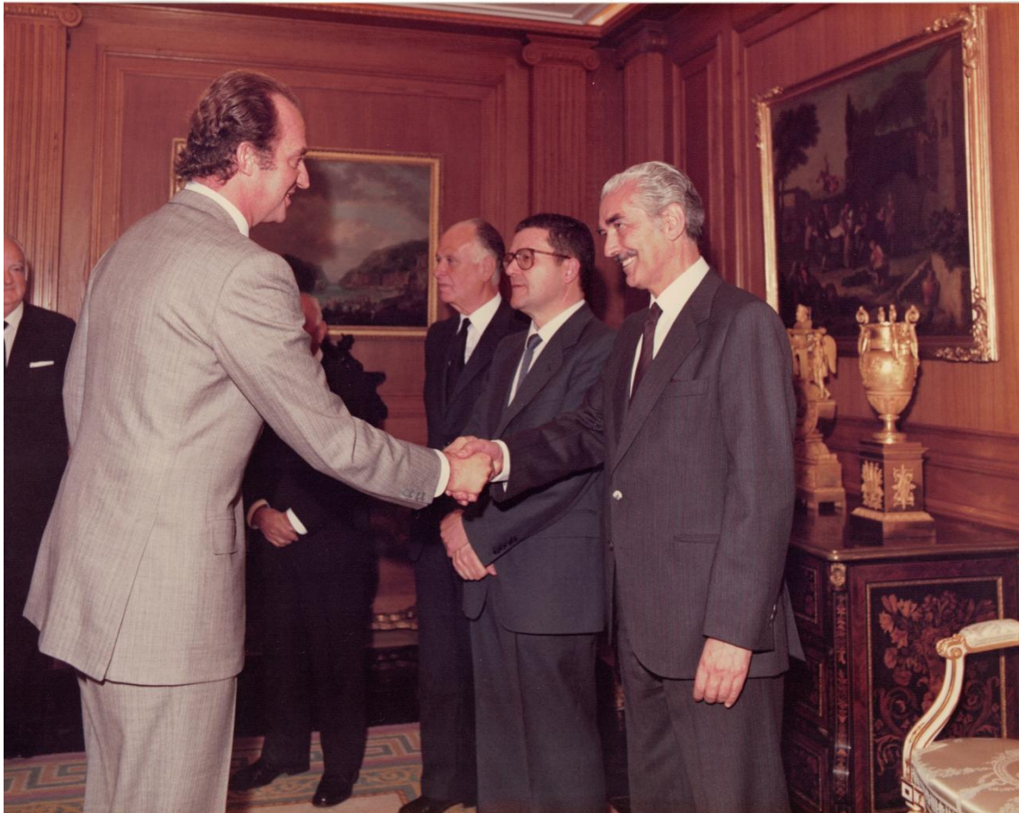
Con el Rey D. Juan Carlos

1998. Los antioxidantes de los alimentos , en la monografía nº 6 del año 2000. El desarrollo de fármacos selectivos en la nº 7, en el año 2001 y Farmacogenética, farmacogenómica y proteómica en la medicina personalizada , en la monografía nº 15, del año 2004.