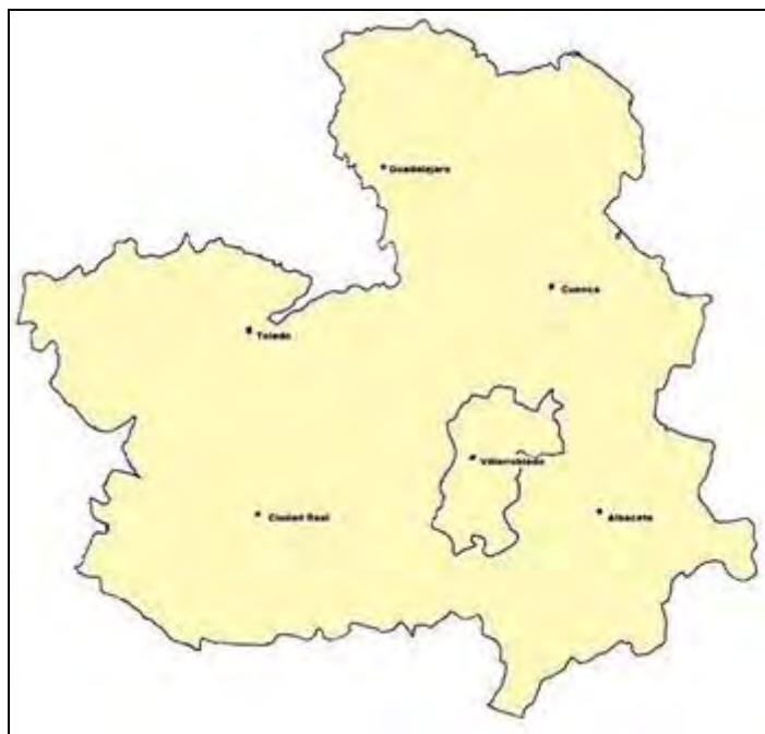
Figura1. Localización de la gerencia de Atención integrada de Villarrobledo, en la comunidad autónoma de Castilla La Mancha

Se ha realizado una recogida de las publicaciones en las que ha participado personal del hospital general de Villarrobledo mediante búsqueda en Google Académico empleando como término de búsqueda “hospital Villarrobledo”, en Scopus mediante el término “Villarrobledo” en todos los campos, en PubMed con el termino de búsqueda “Villarrobledo”, y en la Web of Science (WOS) empleando el mismo término de búsqueda. Las búsquedas se han desarrollado en enero del 2018. Se han seleccionado los trabajos que correspondían a cualquier tipo de artículo en revista científica publicado desde el 1 de enero del 2013 (fecha de la creación de la gerencia de atención integrada de Villarrobledo) y 2017. Se ha completado esta búsqueda con los datos aportados directamente por profesionales del centro, de utilidad para localizar otras publicaciones no indexadas. Se han excluido los abstracts de comunicaciones a congresos publicados en suplementos de revistas, o las publicaciones que incluyeran autores de atención primaria de la gerencia de Villarrobledo, pero no del hospital, ya que el objetivo principal de este trabajo es la investigación en este centro hospitalario.