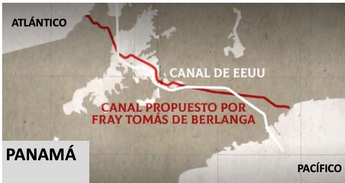
Figura 3. Proyecto de Fray Tomás y canal de Estados Unidos

Este fue el primer estudio realizado para la construcción de un canal que permitiera a los buques cruzar de un océano al otro por Panamá, y su curso seguía más o menos el del actual Canal de Panamá. Para cuando se terminó el levantamiento del mapa, el gobernador opinó que sería imposible para cualquiera lograr tal hazaña. Su idea se materializaría siglos más tarde con la obra de canalización del Chagres, y el consiguiente Canal de Panamá.