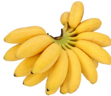
Figura 4. Plátano “dominico”

Fue también Fray Tomás el primer español que comenzó a plantar el tomate de forma intensiva. Además, fue el responsable de la agricultura organizada en el Nuevo Mundo, gracias a él se trasladaron las técnicas agrícolas de nuestro país a Centroamérica, y a él también debemos la introducción en el Viejo Continente no sólo del tomate, sino también la patata y el perejil. Por todas estas innovaciones dietéticas y gastronómicas Fray Tomás de Berlanga es considerado por muchos el patrón de la Dieta Mediterránea. Esta dieta, incorporada a nuestro lenguaje cotidiano, fue declarada, a mediados del año 2010, Patrimonio Cultural Inmaterial de la Humanidad, en denominación conjunta para España, Grecia, Italia y Marruecos (7,8) .