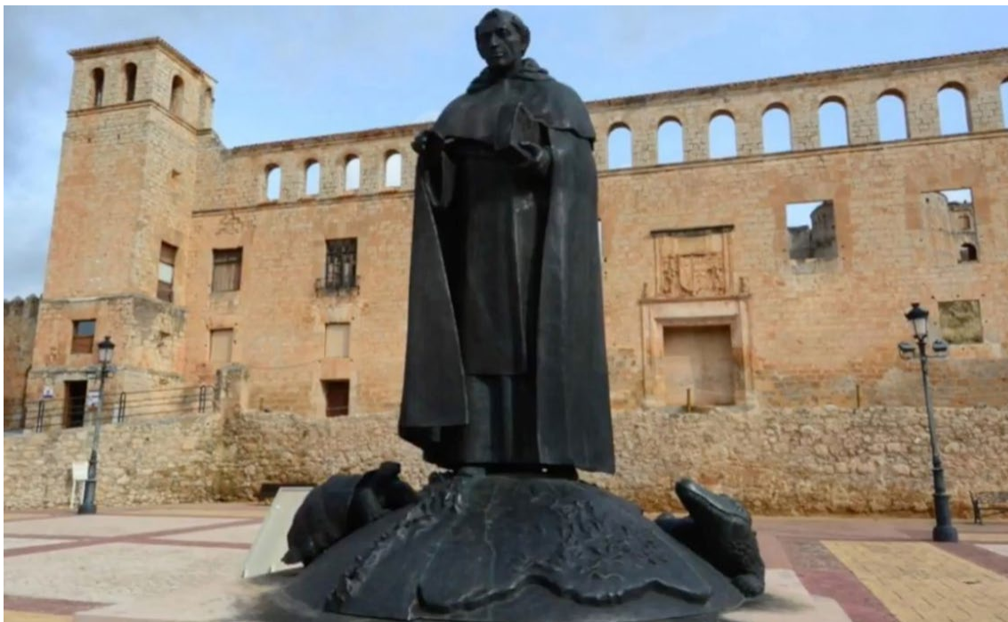
Figura 5. Fray Tomas. Al pie el recuerdo de Las Galápagos y “el Lagarto”

“Lagarto de Fray Tomás”. Se trata un caimán negro, disecado, que trajo de Panamá fray Tomás de Berlanga en 1543 y que ofreció a la colegiata de su pueblo natal. Había regresado tras una vida culminada como tercer obispo de Panamá, consejero de Carlos V, inquieto viajero y curiosa persona creativa. Hoy, el pueblo natal de fray Tomás no llega a 1.000 habitantes y casi nadie recuerda su nombre. Eso sí, pueden alojarse en el Hotel Fray Tomás. También, como curiosidad, el libro de José Javier Esparza, “Almanaque de la Historia de España”, menciona como Efemérides del 23 de febrero: 1535: Fray Tomás de Berlanga, obispo de Panamá, descubre las islas Galápagos (10) .