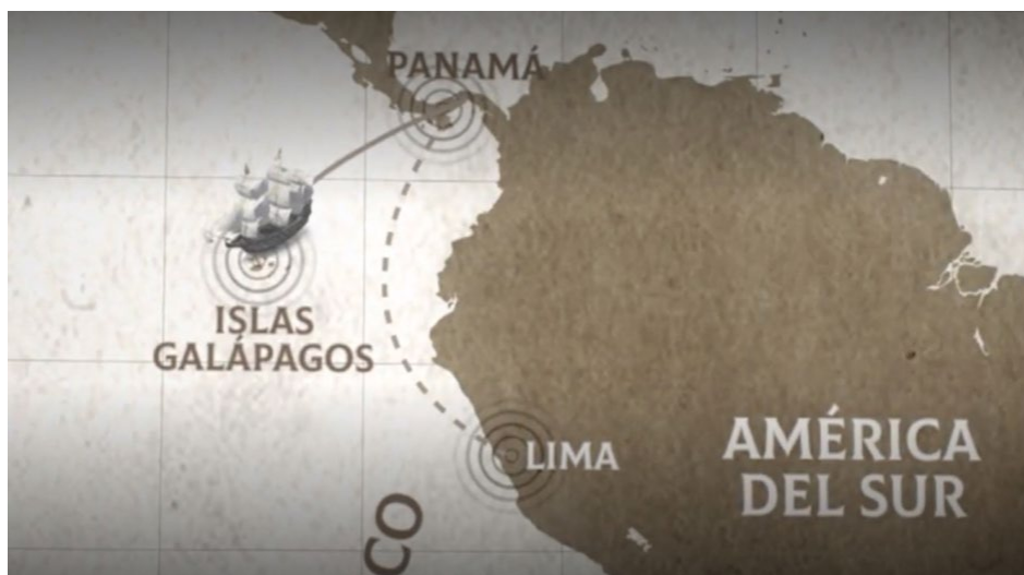
Figura 1. Rumbo previsto (Panamá-Lima) y deriva causada por la corriente

El 23 de febrero de 1535 salía desde Panamá con rumbo a Lima. La nave en la que viajaba estuvo costeano el litoral durante siete días, tras los cuales, abandonados por los vientos y arrastrados por las fuertes corrientes, se internaron hacia mar abierto hasta que divisaron una isla de lo que posteriormente se llamó archipiélago de las Galápagos, siendo los primeros europeos en pisarlas. La zona de calmas ecuatoriales dejó el barco a merced de la corriente que lo llevó a tropezar con la isla. La corriente los empujó hacia el Occidente, llegando a Galápagos el 10 de marzo. El archipiélago, quedaba alejado casi mil kilómetros de las costas ecuatorianas, y estaba compuesto por diecinueve islas y decenas de islotes. En la Figura 1 puede verse el cambio de rumbo causado por la corriente. Y decía Fray Tomás: “eran tan grandes las corrientes que nos engolfamos, de tal manera que miércoles en diez de marzo vimos una isla...” (2,3) .