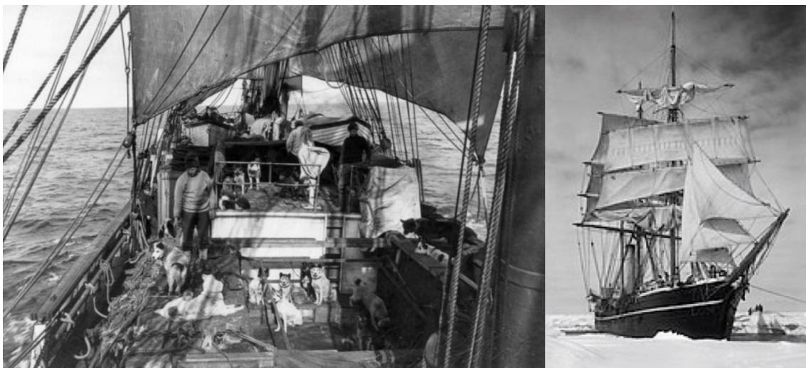
Figura 2. A bordo del Terra Nova

El buque Terra Nova era un ballenero que costó más de 12.000 £ y que, además, había que adaptar (Figura 2). En su momento había participado en el socorro de la expedición Discovery . El barco no superaba los criterios de navegación de la Board of Trade, así que Scott consiguió encuadrarlo en el Real Escuadrón de Yates y que tuviera rango de navío de la Royal Navy. De ese modo pudo enarbolar la White Ensign, mezcla de la cruz de San Jorge y de la bandera de la Unión propia de la Royal Navy. El Terra Nova desplazaba 744 toneladas, tenía una eslora de 57 metros, una manga de 9,6 metros y un calado de 5,8. La propulsión era a vela y motor (vapor) y podía alcanzar algo más de 10 nudos de velocidad (6,7) .