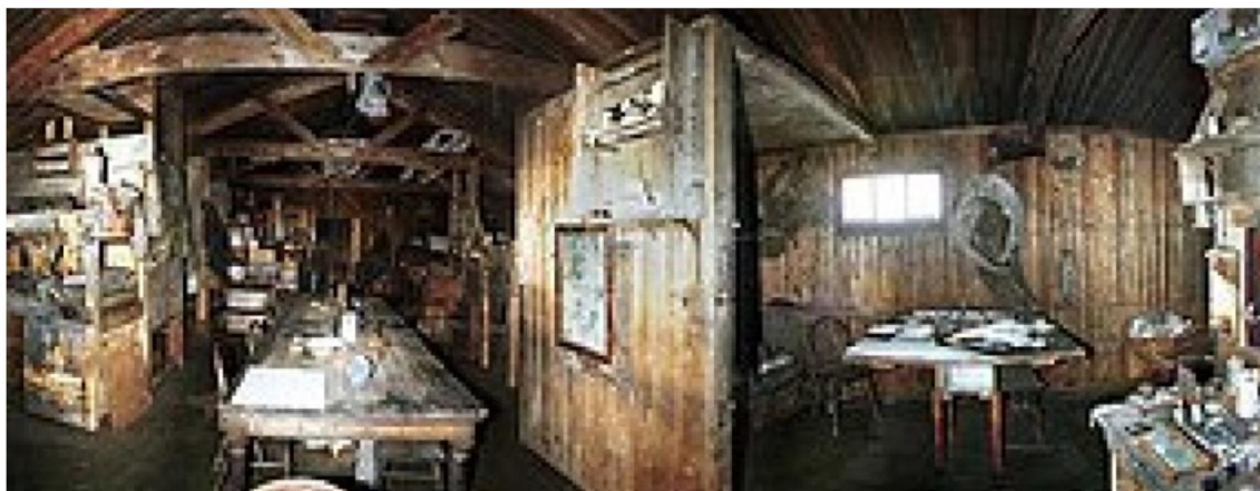
Figura 3. "Cabaña Terra Nova"