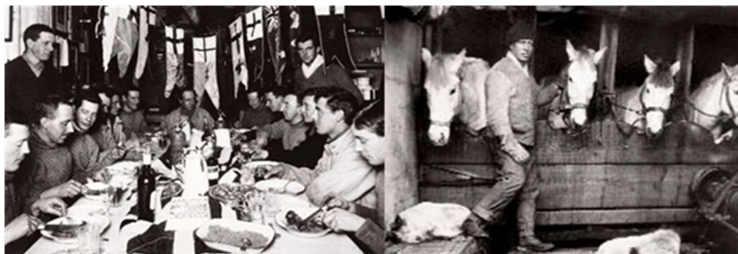
Figura 4. Vida de la expedición (Scott presidiendo la mesa)

Tenían que empezar a caminar hacia el Polo y para ello Scott decidió instalar depósitos de víveres desde donde estaban ( Safety Camp ), límite Norte de la barrera de hielo, hasta los 80° S. Todo ello antes de que llegara la "noche polar" (noche de más de 24 horas de duración; en ese período no hay sol ni crepúsculo y en muchas personas origina síntomas depresivos), que se iniciaría en la siguiente primavera. Comenzaron los trabajos a finales de enero instalando un primer depósito ( Corner Camp ) a unas 40 millas de Hut Point . En 79°29' S instalaron el depósito One Ton (a más de 200 Km de Cabo Evans), aunque su idea, como se ha dicho, era llegar a los 80° S (dato importante, pues de haberse alcanzado la Latitud inicialmente prevista tal vez el trágico final que les esperaba no se habría producido). Tras estos trabajos sólo les quedaron 2 caballos con vida (de los 8 que empezaron a trabajar). Tras instalar todo ello, regresaron a Cabo Evans (unos 210 Km), estaban en abril de 1911 (Figura 4) (8-10)