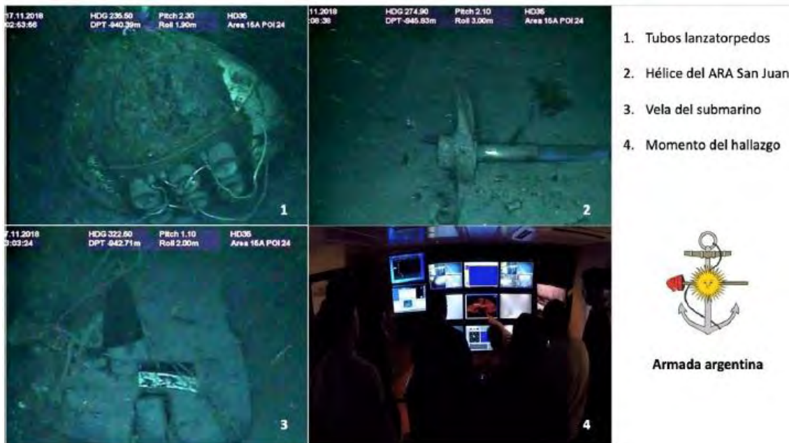
Figura 2. Detalle de algunas partes del ARA San Juan