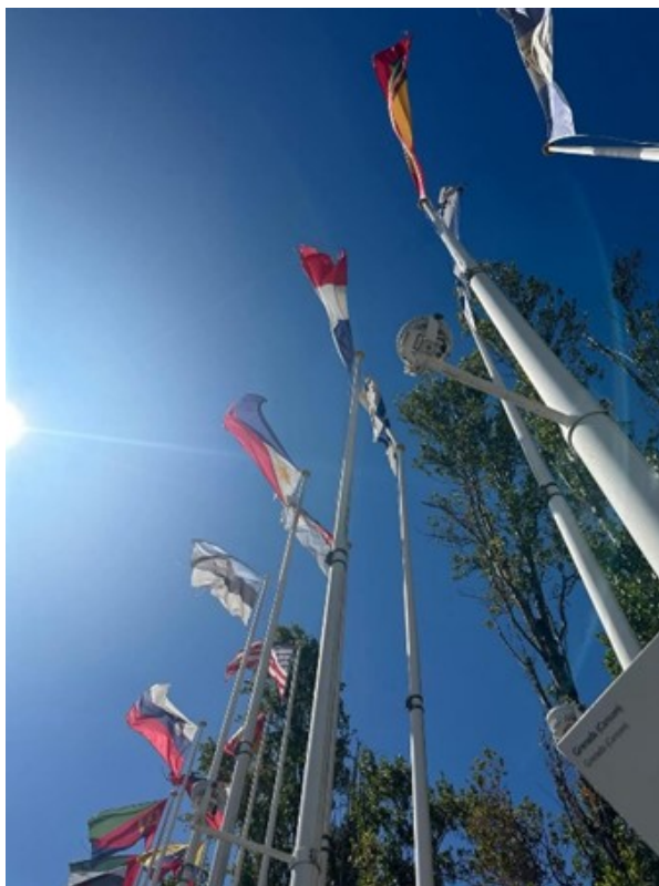
Figura 3. Imagen que posibilita la construcción de ciudadanía europea.

A continuación, para ilustrar el trabajo realizado por el alumnado de ambas universidades a través de Photovoice , se muestran las dos imágenes finales seleccionadas, con los respectivos comentarios realizados colectivamente a partir del instrumento “SHOWED”.