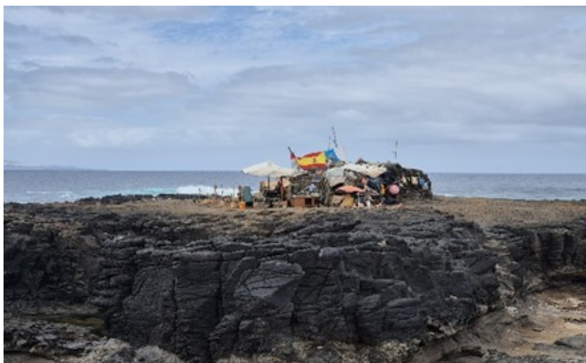
Figura 4. Imagen que no posibilita la construcción de ciudadanía europea.

Fuente: Marenzo Le Brun (2025). Fotografía realizada en las Islas Canarias (2025).