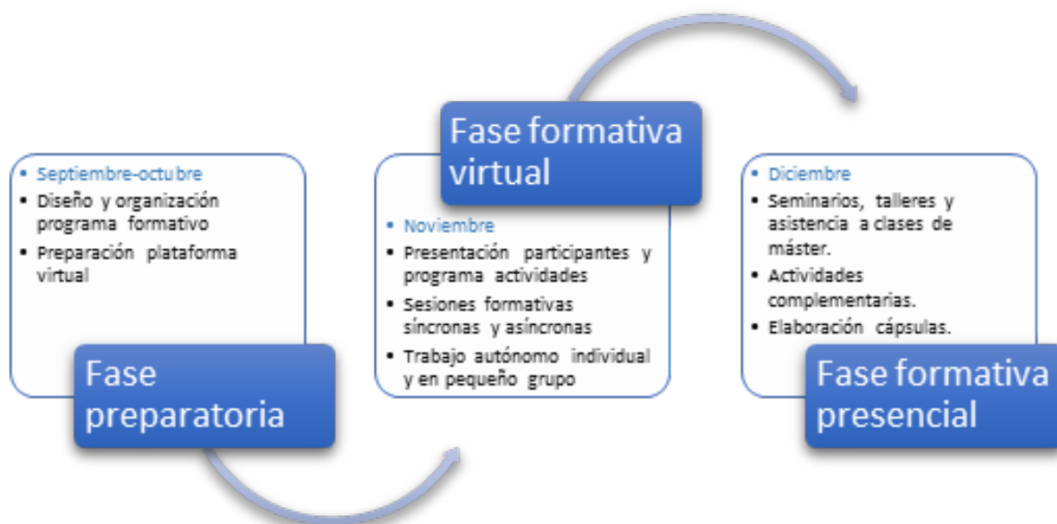
Figura 1. Cronograma programa formativo.

La Figura 1 muestra el cronograma de las tres fases del programa formativo.