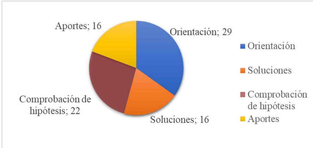
Figura 3. Hallazgos relevantes encontrados.