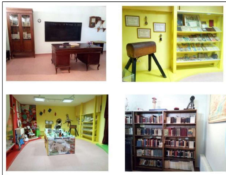
Figura 3. Estancias del Museo Waldo Ferrer

para ser realmente didáctico, exigía un análisis y una valoración individual que facilitaba la comprensión de la importancia de dicho centro escolar en su municipio. Además, se logró que la población adulta fuera uno de los pilares en los que se apoyara el Museo, siendo sus aportaciones orales o materiales el mayor reclamo para este tipo de iniciativas turísticas.