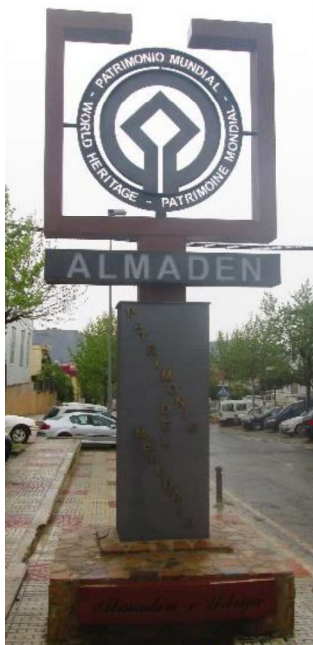
Figura 2. Imagen Monolito Patrimonio Nacional de la UNESCO.

(q).- Aprobación del expediente “La Ruta del Mercurio: Almadén e Idrija” y la inscripción en la lista de Patrimonio Mundial de la UNESCO del patrimonio del mercurio de ambas localidades (2012), confirmándose su valor universal y la necesidad de ser protegido y conservado para el bien de la humanidad . Con este reconocimiento no sólo se potenciaba el Parque Minero de Almadén como iniciativa turística, sino el resto del patrimonio histórico-minero existente en la localidad: Plaza de Toros, Castillo de Retamar, Casa Academia de Minas, Puerta de Carlos IV, Real Cárcel de Forzados y Real Hospital Minero de San Rafael.