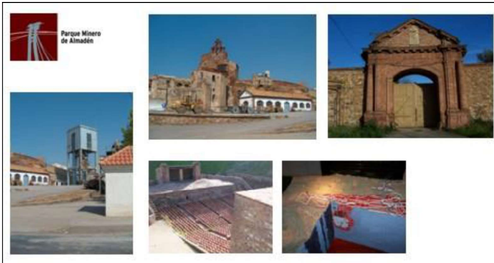
Figura 1. Imagen Parque minero de Almadén

(n).- Defensa del expediente “El Binomio mercurio plata en el Camino Real Intercontinental” en la Convención de la UNESCO para la elección de lugares Patrimonio Mundial, celebrada en Sevilla (2009).